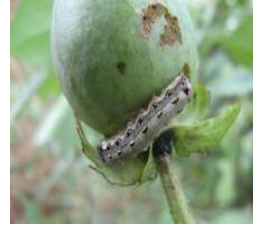
ਤੰਬਾਕੂ ਦੀ ਸੁੰਡੀ Tobacco Caterpillar