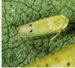
ਹਰਾ ਤੇਲਾ Jassid