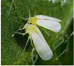
ਚਿੱਟੀ ਮੱਖੀ Whitefly