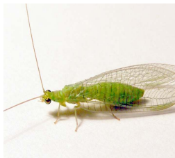
ਗ੍ਰੀਨ ਲੇਸ ਵਿੰਗ Green Lace Wing