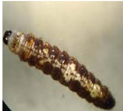
ਚਿਤਕਬਰੀ ਸੁੰਡੀ Spotted Bollworm