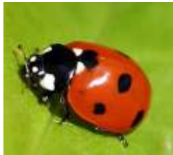
ਲੇਡੀ ਬਰਡ ਬੀਟਲ Lady Bird Beetle