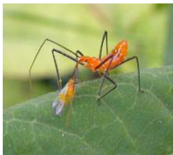
ਅਸਾਸਨ ਬੱਗ Assassin Bug