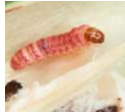
ਗੁਲਾਬੀ ਸੁੰਡੀ Pink Bollworm