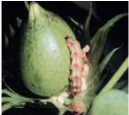
ਅਮਰੀਕਨ ਸੁੰਡੀ American Bollworm